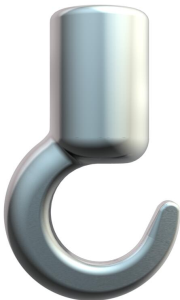
Stropní hák M6