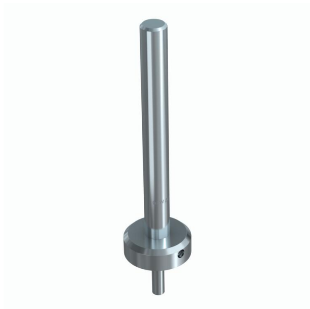
Montážní nástroj BZ-IGS pro průvlakovou montáž.